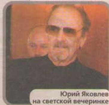
Юрий Яковлев на светской вечеринке